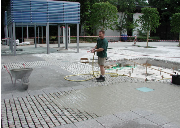
1. Fläche vornässen