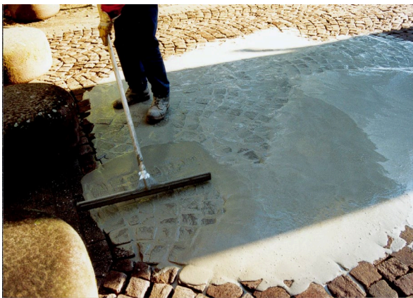
2. CEMPRO PFM einschlänmen