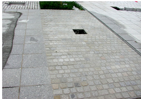
5. Fertig verfugte Fläche