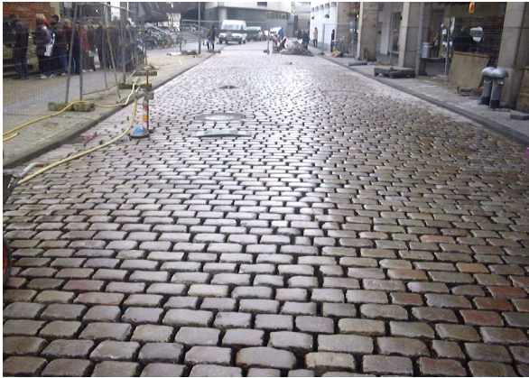
1. Fläche vornässen