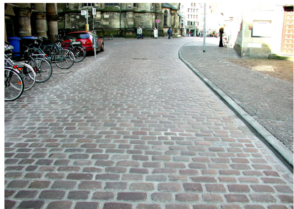
6. Fertig verfugte Fläche