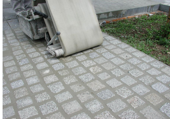
4. Reinigung mit Schwammputzmaschine