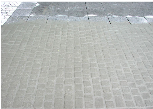
3. Fertig eingeschlämmte Fläche