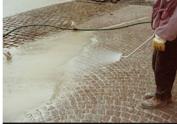
4. Reinigung mit CEMPRO Fächerdüse