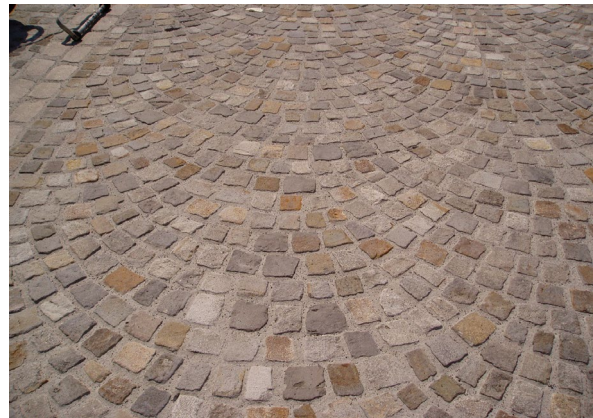
5. Fertig verfugte Fläche