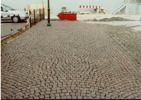
1. Fläche vornässen