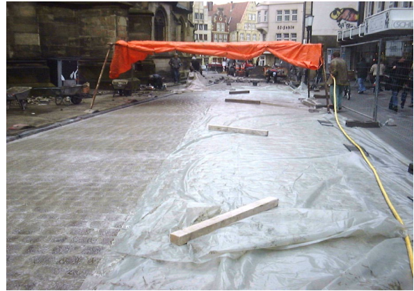
4. Fläche abdecken