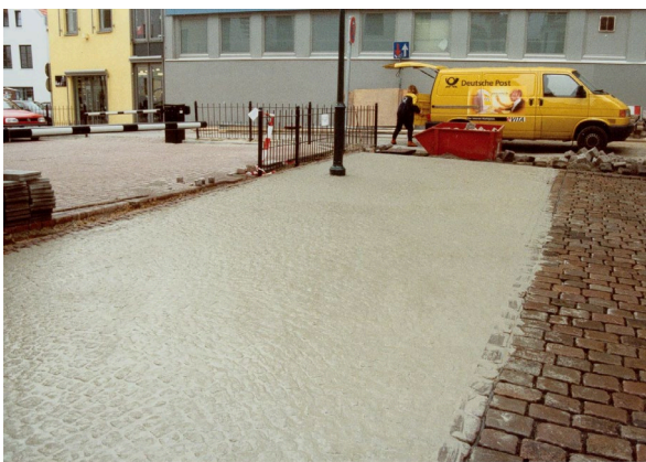
3. Fertig eingeschlänmte Fläche