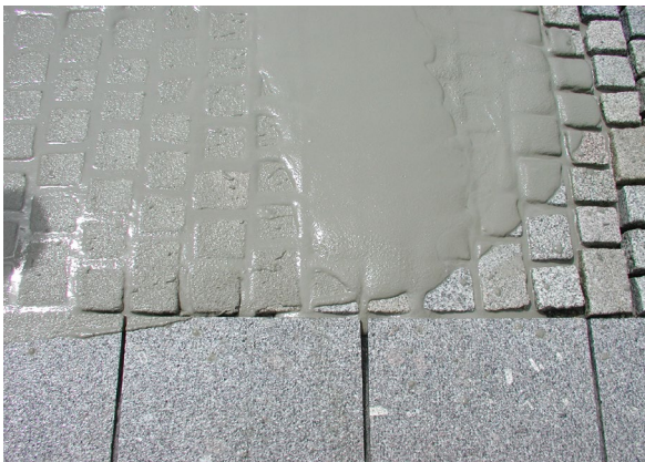
2. CEMPRO PFM einschlämmen