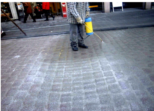
3. Fläche mit RS einsprühen