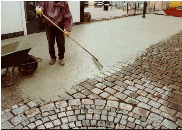
2. CEMPRO PFM einschlänmen